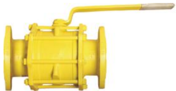
Tabak Yay Takviyeli İçİ Dolu Paslanmaz Küreli