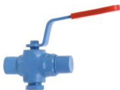
Dövme Çelik 2 ve 3 yollu +250 °C den sonra KAF ring kullanılır.