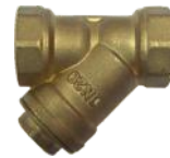
Pirinç Gövde Pirinç Kapak Paslanmaz Çelik Filtre