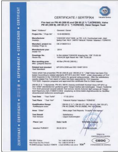
FIRE SAFE KÜRESEL VANALAR-ÇELİK