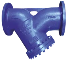
Boşaltım Tapası Piring Paslanmaz çelik Filtre