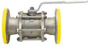
Tabak Yay Takviyeli İçİ Dolu Paslanmaz Küreli