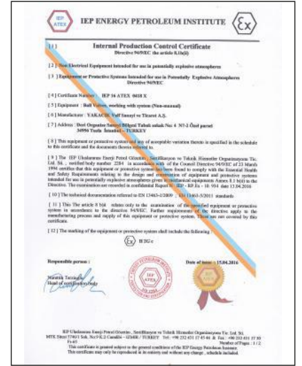
ATEX 94/9/EC the article 8.1b(ii)