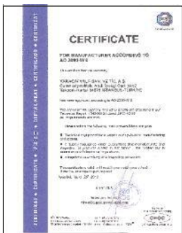
AD 2000 - W 0 İMALAT YETERLİLİK BELGESİ