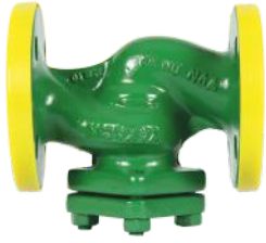
Paslanmaz Çelik Filtre