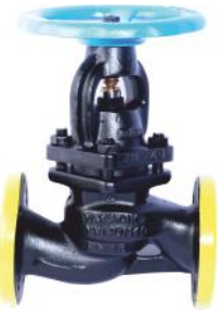
İç Aksamı Komple Paslanmaz