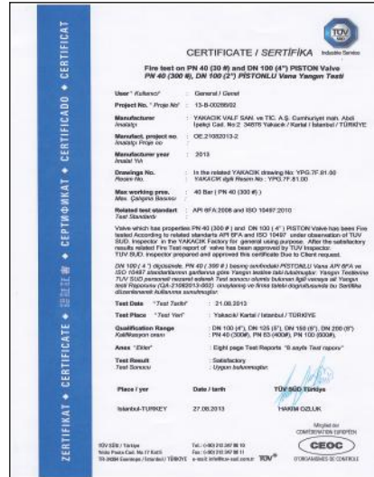
FIRE SAFE PİSTONLU VANALAR-ÇELİK